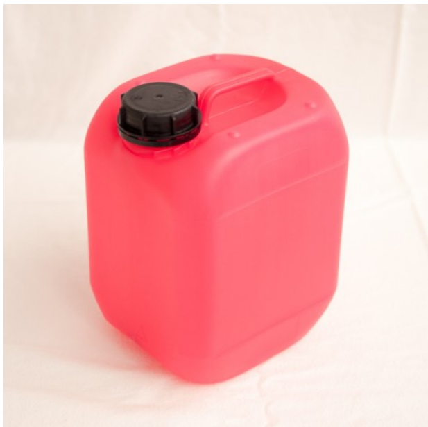
Produit A Utilisation 2 %