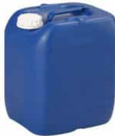
Produit B Utilisation 0.5 %

Incompatibilité d'un DM avec le produit A, utilisé depuis 20 ans en toute satisfaction