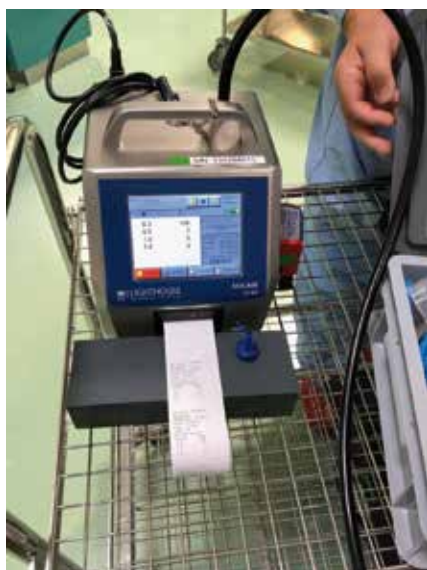
Photo 3 Appareil Lighthouse Solair S3100 pour le dénombreage des particules (ici, dans la salle blanche).

Le comptage des particules a été effectué au moyen de l'appareil Lighthouse (Solair S3100) (photo 3).