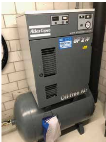
Photo 1 Monobloc composé du sécheur et du compresseur de la marque Atlas Copco. Sous le bloc, une de deux bonbonnes de réserve. 2