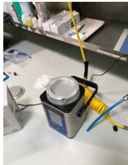
Photo 7 ActiveCount 100 Lighthouse.

Ces contrôles ont été faits avec l'appareil Active-Count 100 Lighthouse (photo 7). Une plaque de culture (agar-agar) a été déposée dans l'appareil, pour analyser 1m 3 d'air comprimé.