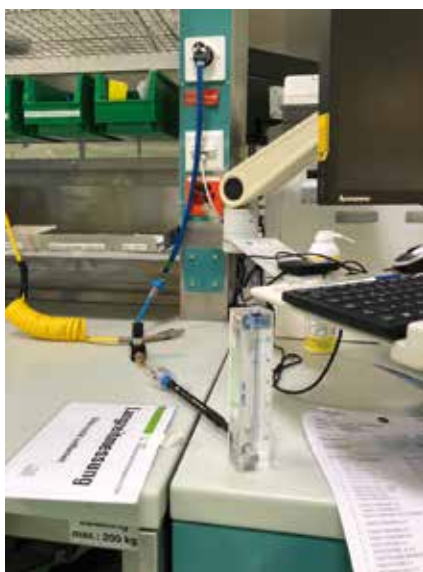
Photo 6 Filtre à charbon actif, raccordé pendant 24h à l'air comprimé.

Dans les deux cas, le débit d'air était de 4 l/min.