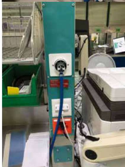
Photo 2 En haut: lieu de production de l'air comprimé, prélèvement après les filtres; l'appareil de mesure a été raccordé via une valve de sécurité. En bas: poste de travail 6 dans la salle blanche (zone jaune); raccord de prélèvement pour analyses.