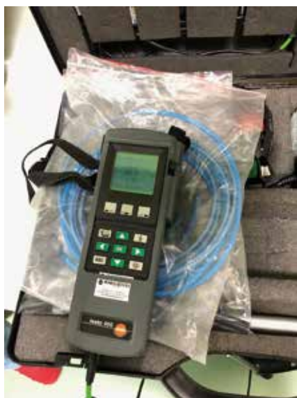
Photo 4 Appareil Testo 400 pour les analyses du point de rosée (analyses hygrométriques).

Les mesures hygrométriques ont été effectuées au moyen de l'appareil Testo 400 (photo 4).