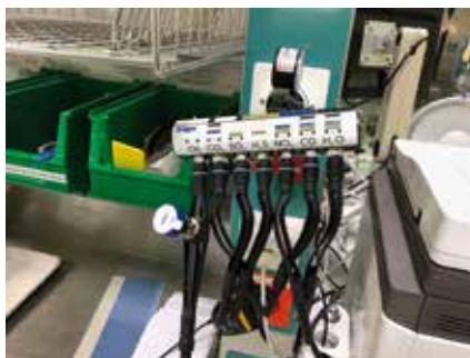
Photo 5 Filtre Dräger pour le contrôle visuel de la présence d'huile dans l'air comprimé.

La teneur en huile de l'air comprimé a été mesurée au moyen de plusieurs méthodes. D'abord, avec un filtre Dräger (photo 5), au travers duquel on a fait passer l'air comprimé. Il s'agit d'un contrôle visuel, l'huile faisant en effet des tâches sur le filtre.