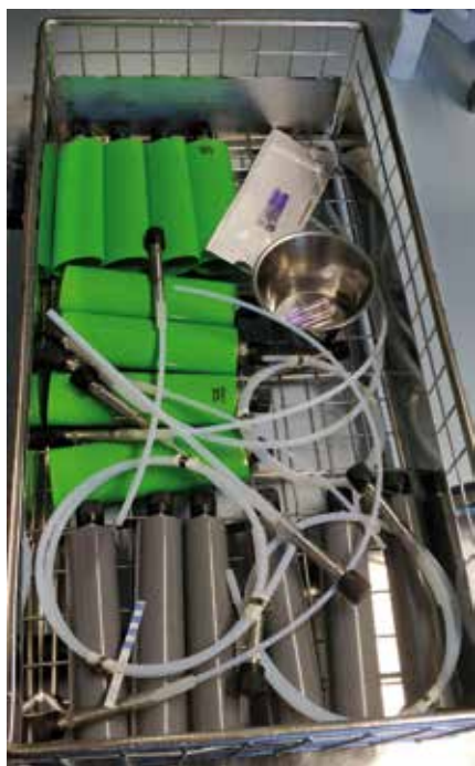
Abbildung 1 Testbelastung.

Bei den Helixen und Prüfkörper handelte es sich um wesentlich einfachere Modelle, als die bei der Dampfsterilisation verwendeten.