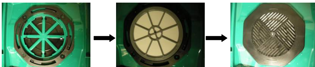
Conteneur sans filtre