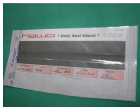
Test soudeuse « Seal Check »