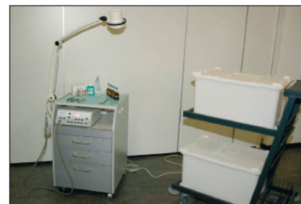
Figura 2 Aula pratica per il riapprontamento dei dispositivi medici.