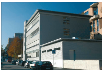
Figura 1 La Scuola superiore medico-tecnica di Lugano.

FORUM che, proseguendo il cammino intrapreso con notevoli sforzi organizzativi, innovativi e economici, da quest'anno ha aumentato la qualità e la quantità della propria offerta formativa nell'ambito della sterilizzazione.