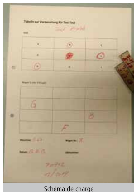
Schéma de charge

Création d'un diagramme pression – température ; test au moyen d'indicateurs de nettoyage : TOSI, gke et Josafe.