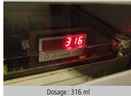
Dosage: 316 ml