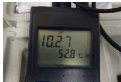
pH 10,27 à 52,8°C