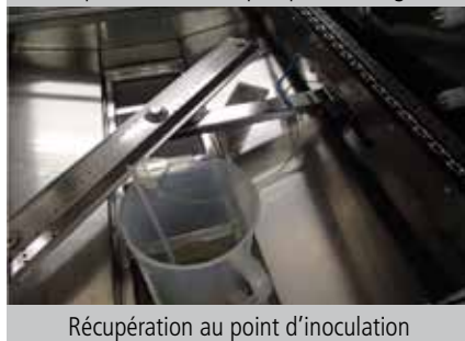
Récupération au point d'inoculation