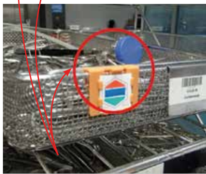
Indicateurs dans panier

Les indicateurs Josafe ont été parfaitement nettoyés. Hormis dans sa zone rouge, l'indicateur gke était propre. Les indicateurs TOSI ont présenté des résidus visibles.