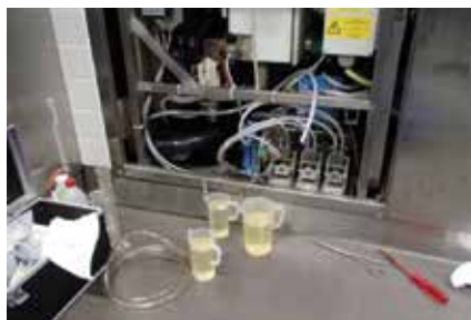
Aspiration avant la pompe de dosage