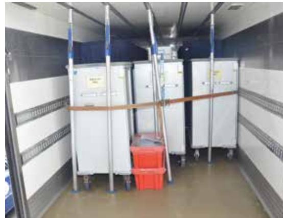
Photo n° 2 Système de fixation dans le camion de transport (réf : Tiziano Balmelli).