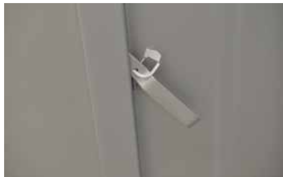
Photo n° 5 Plombage de l'armoire de transport (réf : Tiziano Balmelli).