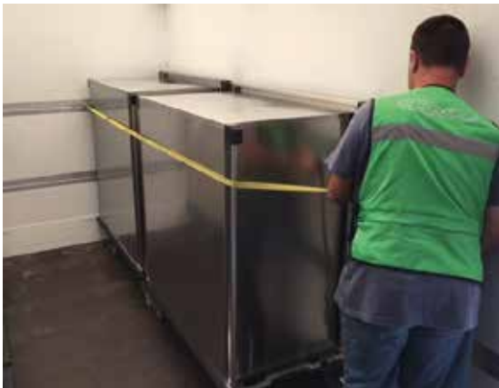
Photo n° 1 Système de fixation dans le camion de transport.

Un système de fixation doit être prévu pour immobiliser les armoires de transport pour toute la durée du transport.