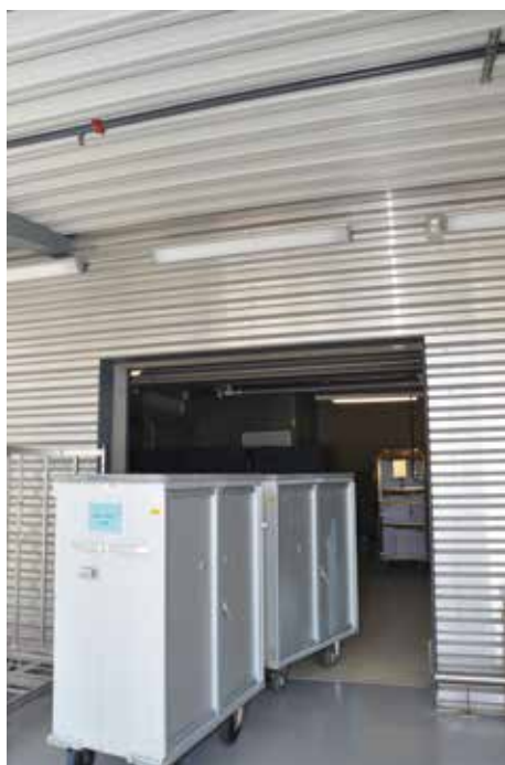
Photo n° 6 Place de chargement/déchargement.

Les locaux de chargement et de déchargement doivent assurer une protection adéquate contre le rayonnement solaire direct sur les armoires de transport.